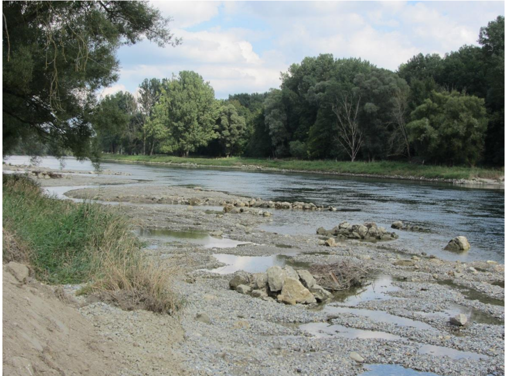
Abb. 7: Kiesbank bei Dünzing

Unterhalb der unteren Vohburger Brücke soll am Gleitufer auf der linken Seite durch die Einbringung von Kies eine Kiesbank angelegt werden (nach dem Vorbild des Kiesbank bei Dünzing). Die Randbereiche müssen mit Wasserbausteinen gesichert werden. Falls der Kies bei Hochwasser abgeschwemmt wird, sollte er durch neue Kiesdotationen ergänzt werden.