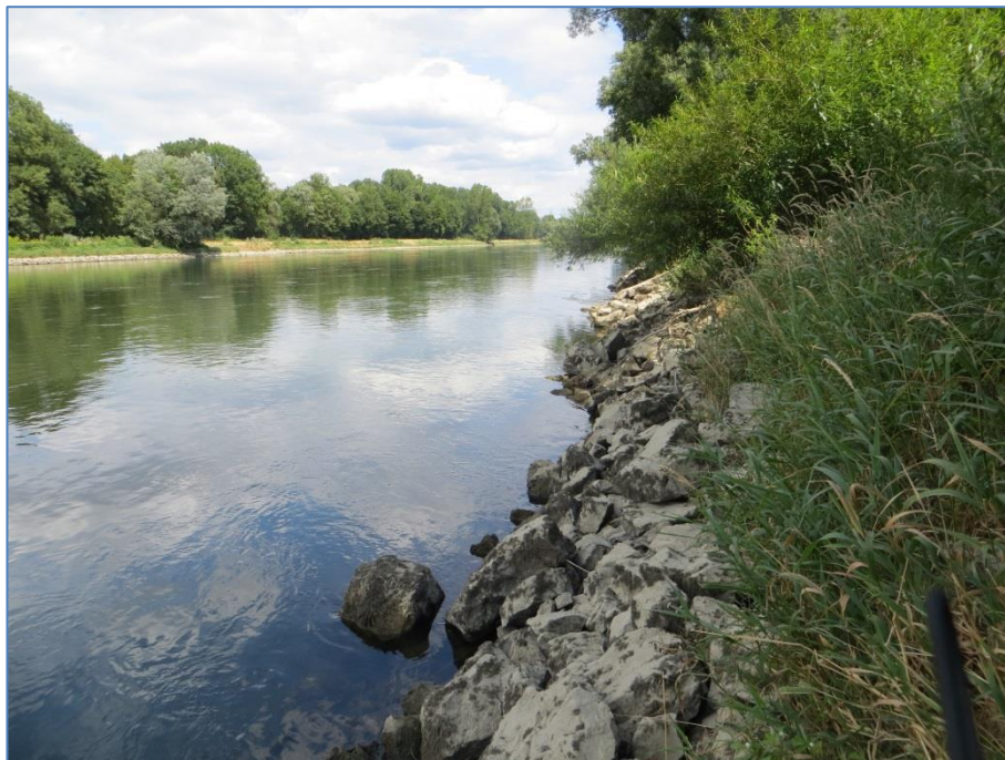
Abb. 6: Verbauung der Donauufer bei Gaden

(Gut zu erkennen: der ursprünglich mehrstromige Verlauf bei Pförring und der neue kanalartige Verlauf nach der Donauregulierung)