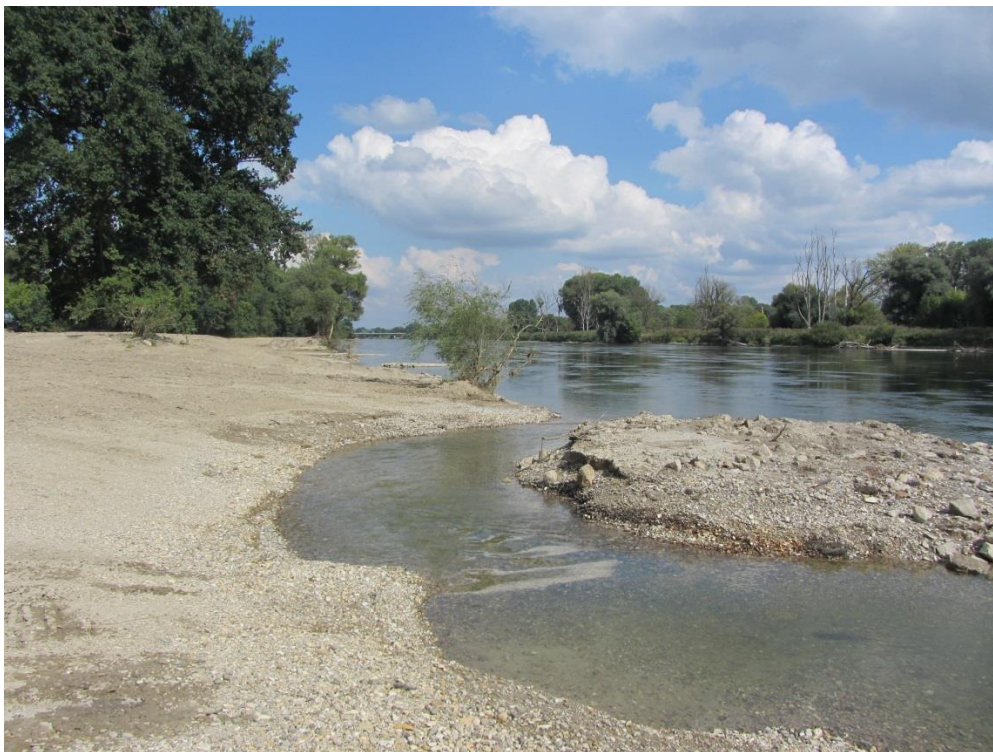
Abb. 4: Renaturiertes Donauufer bei Pförring