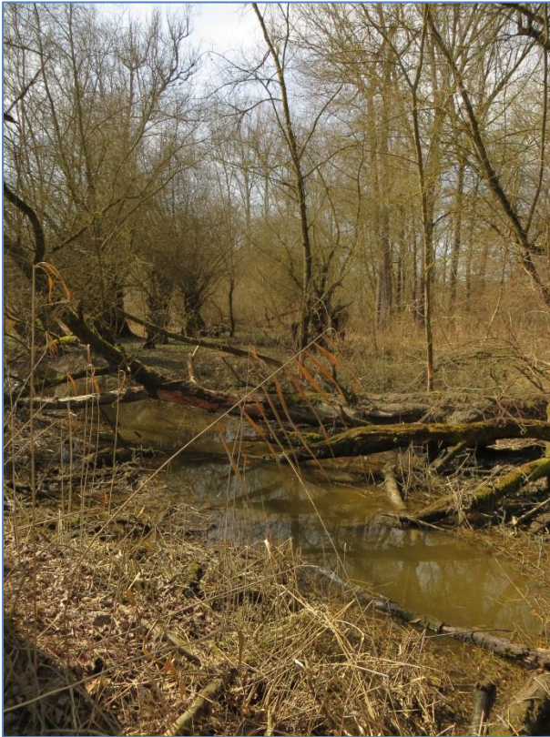
Abb. 3: Altwasser im Auwald bei Irnsing