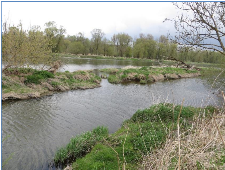
Abb. 2: Donau südlich Eining