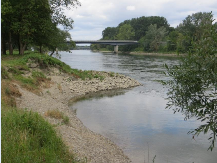
Abb. 1: Donau bei Vohburg

Der FWK 1_F204 „Donau von Einmündung Paar bis Staubing“ ist vollständig Gewässer 1. Ordnung. Zuständig für die Unterhaltung ist von Vohburg bis Neustadt das WWA Ingolstadt und von Neustadt bis Staubing das WWA Landshut.